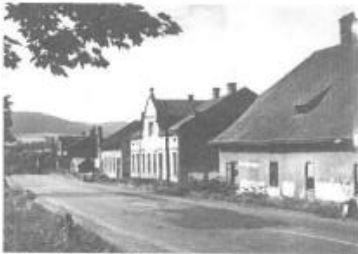
Hostinec Huga Sommera na Nádražní ulici. Dnešní Kachlák