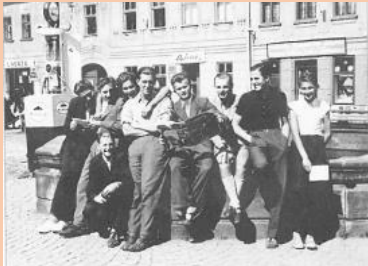
Jablunkovská mládež v roce 1935 u kašny