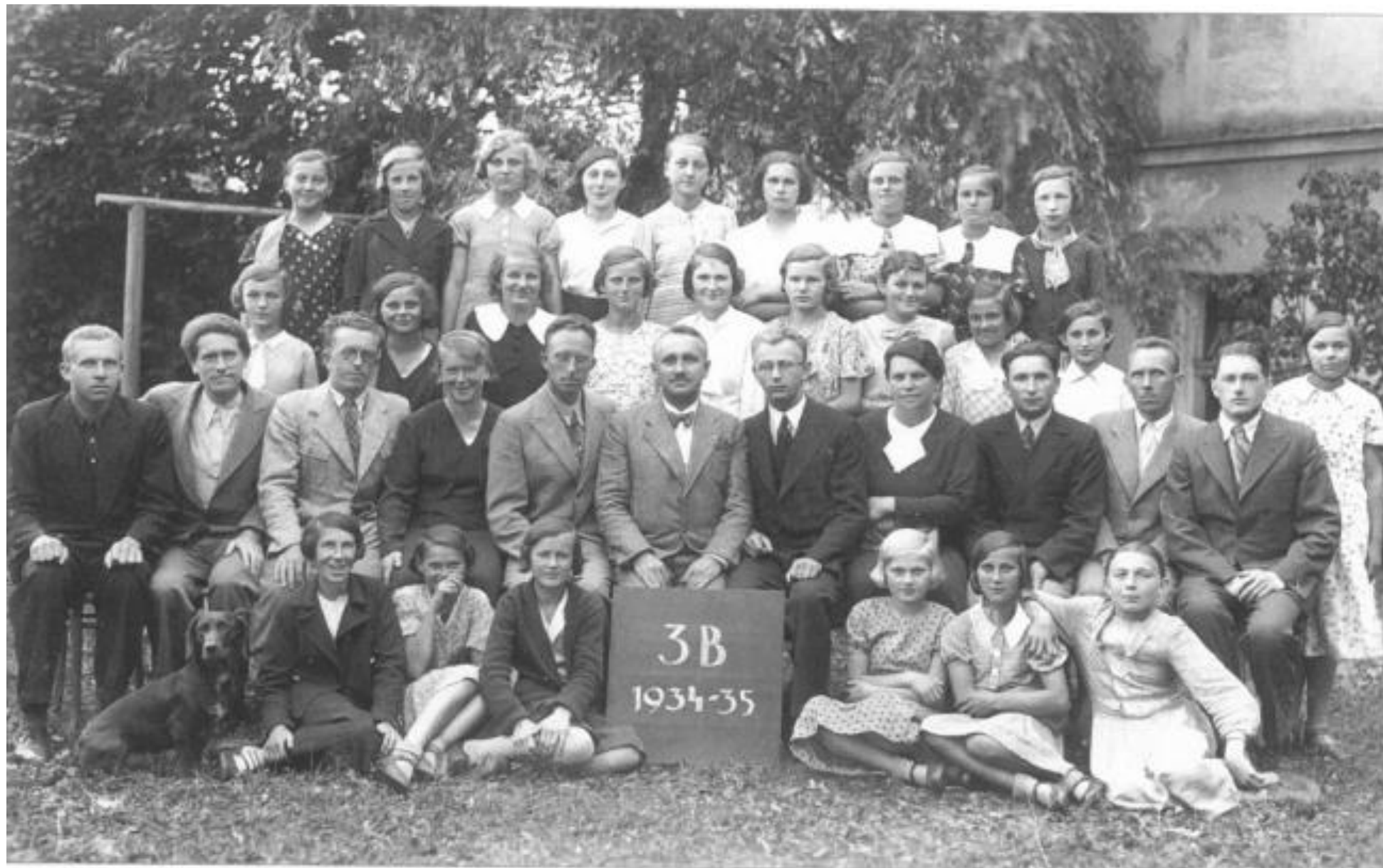
Žákyně 3. B české školy a jejich učitelé ve školním roce 1934 - 35