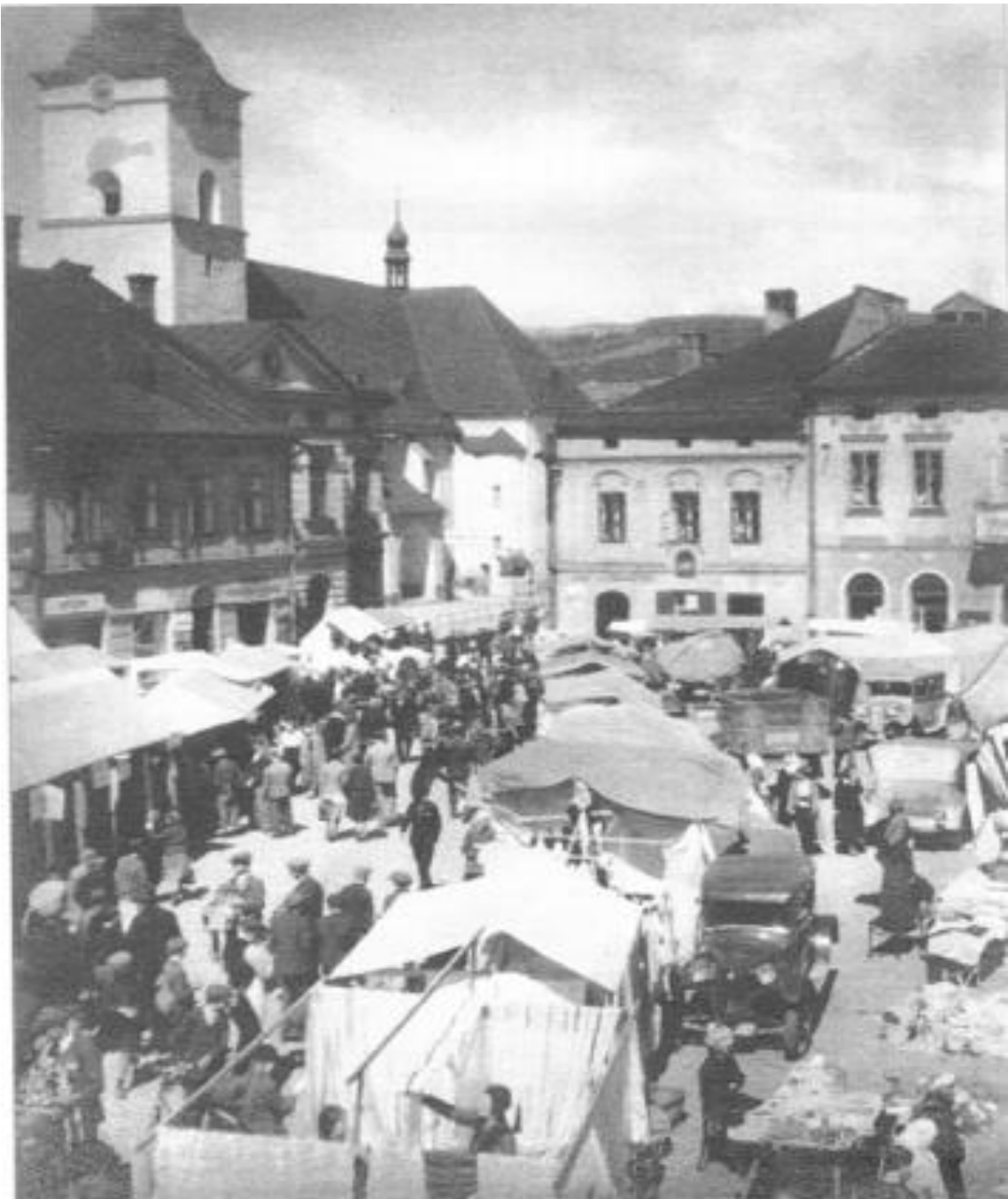
Trh na jablunkovském náměstí v roce 1935