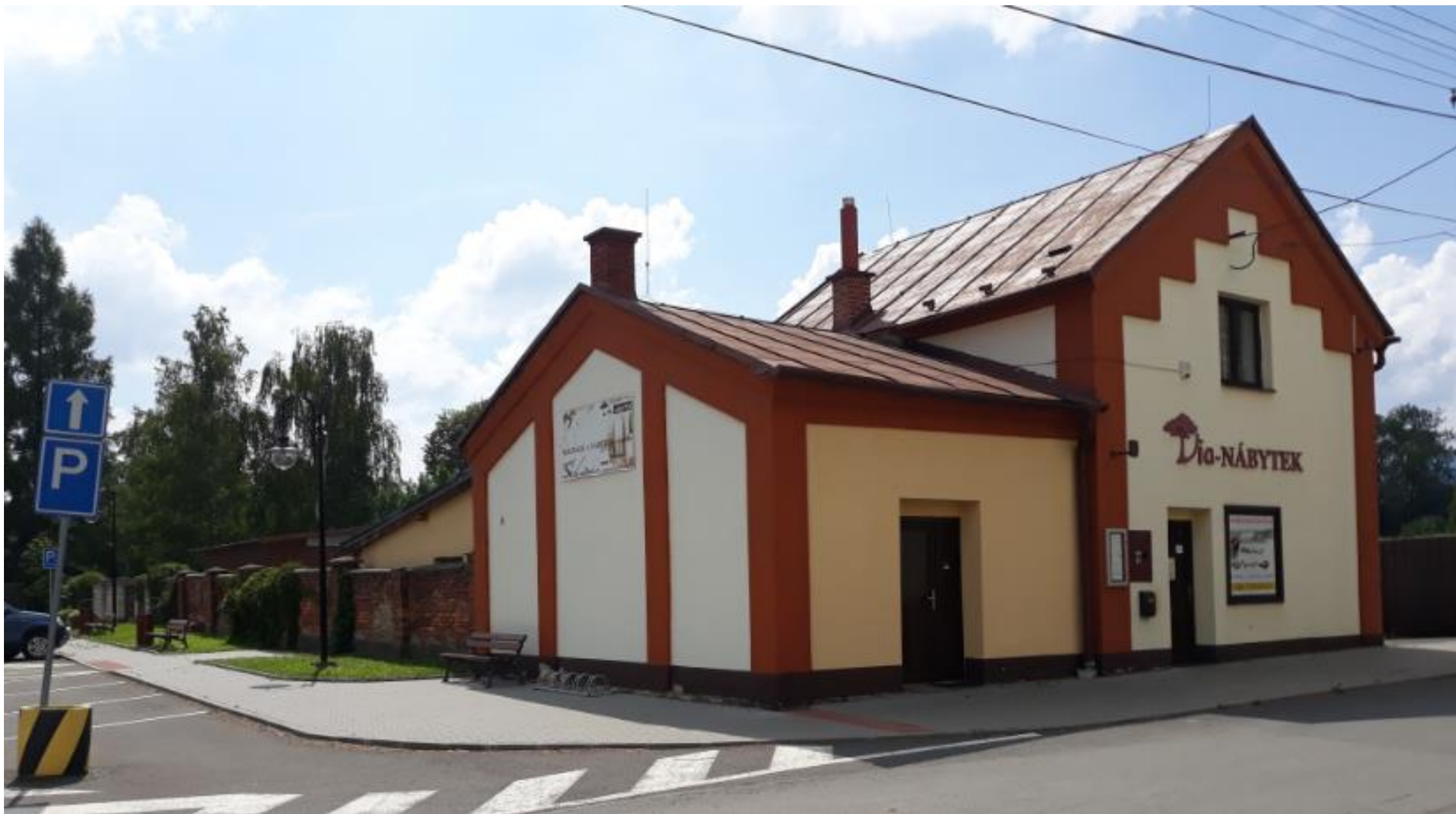
Dnešní stav bývalé židovské márnice – rok 2018