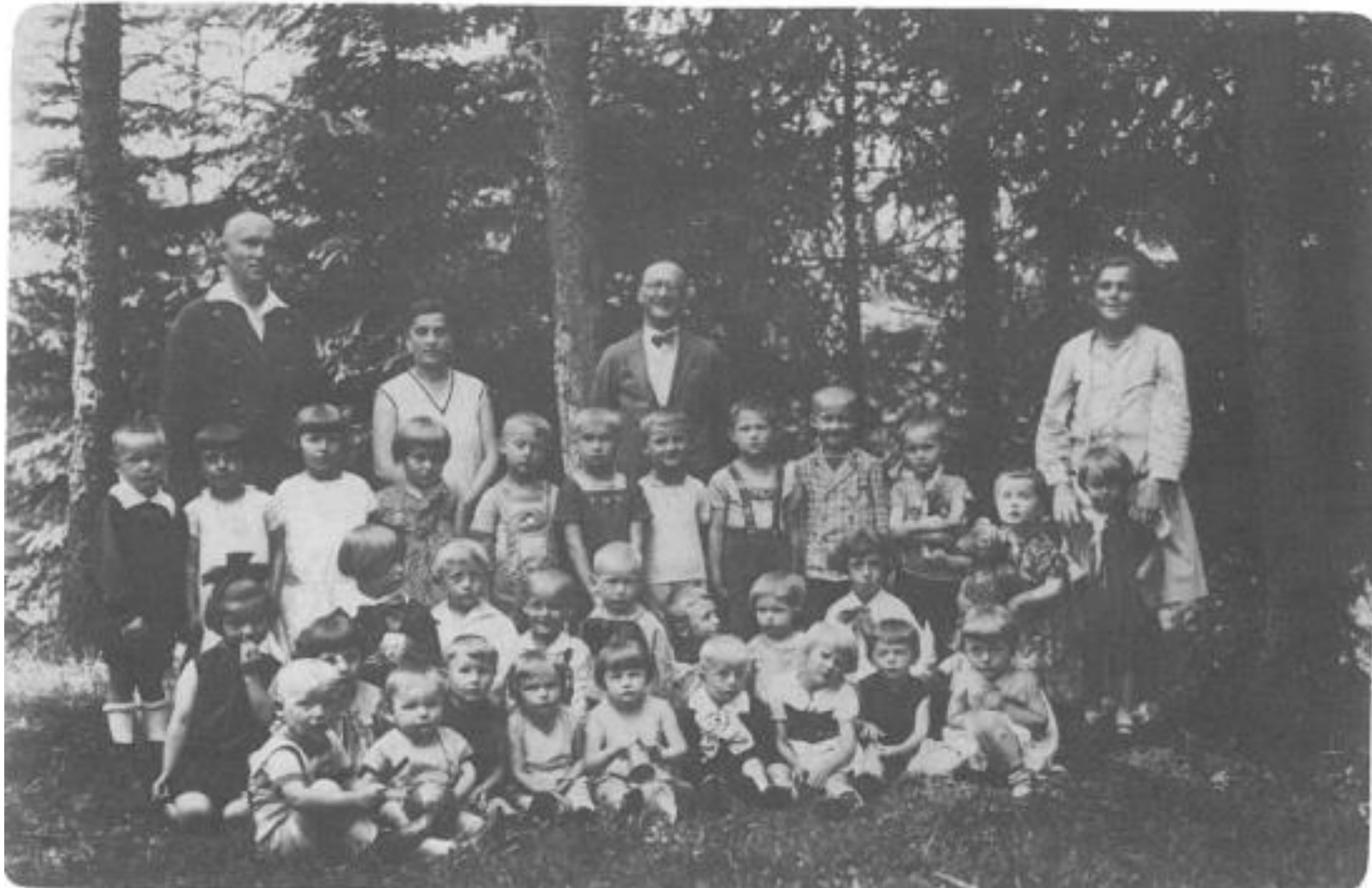
Děti z německé školky – rok 1933