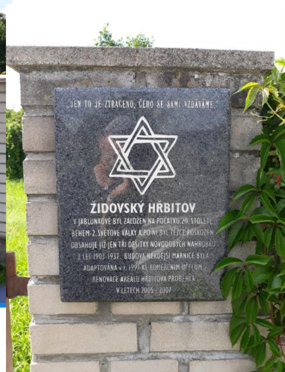
Vchod na židovský hřbitov – kirkut s pamětní deskou, stav r. 2018