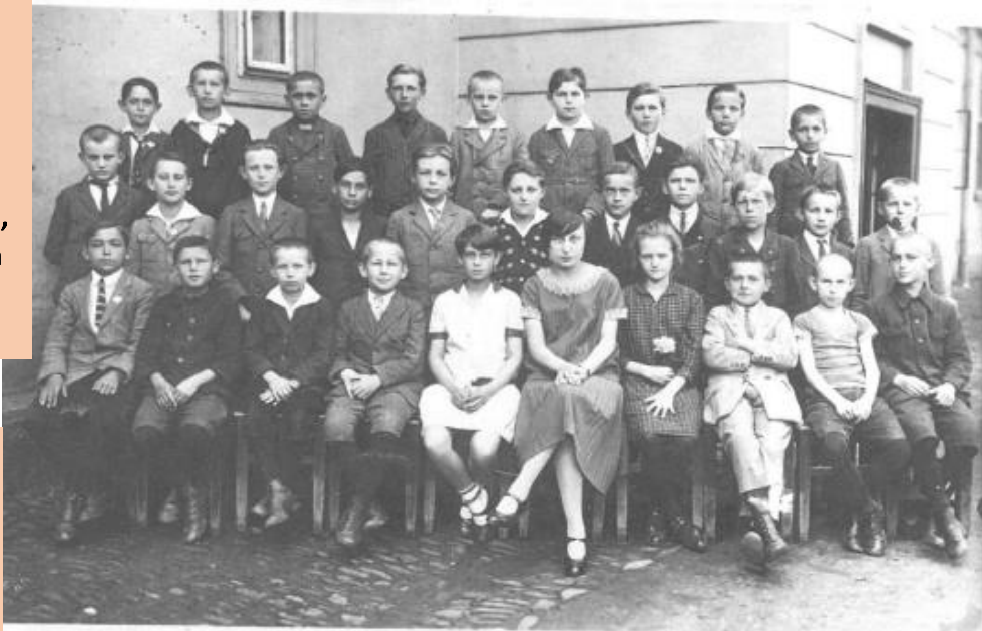
Žáci české školy – školní rok 1925 - 26