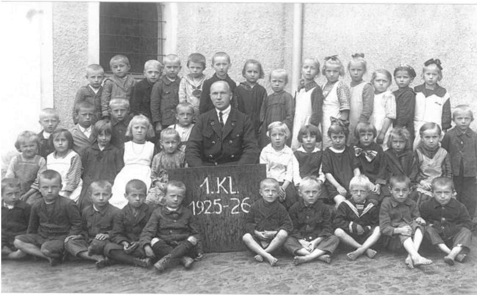
Žáci 1. třídy polské školy ve školním roce 1925-1926

V jakém jazyce se vyučovalo v této třídě?